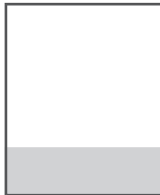
C - 7" x 2,25"